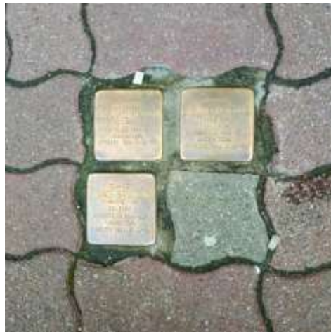
Botlatókövek a Hatvan utcán

emlékezésre, elgondolkodásra készítetik az arra járókat. Debrecenben több mint 30 botlatókő található városszerte. Az első köveket a Szoboszlói út 27. szám alatt a Fahidi család egykor otthona előtt helyezték el. A családból egyedül Fahidi Éva író, holokauszt aktivista élte túl a háború szörnyűségeit, több mint 40 rokona, köztük szülei és testvére veszett oda.