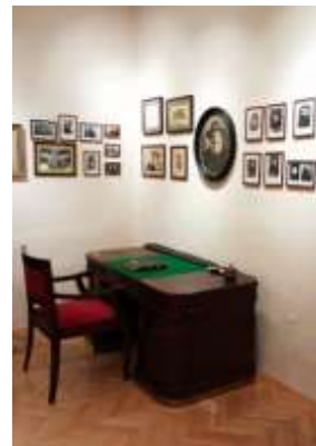
A Debreceni Zsidó Hitközség székháza és a rabbiszoba