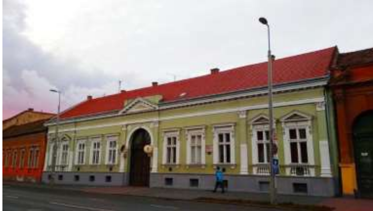
Hatvan utca 23.

A Hatvan utca 23. szám alatti épületnek különleges szerepet szánt a sors. Itt látta meg a napvilágot Csokonai Vitéz Mihály, majd a költő halálának 100. évfordulóján 1905. május 22-én itt nyitott meg a Városi Múzeum, a mai Déri Múzeum elődje. A múzeumi kiállítások felügyeletét eleinte maga az adományozó, alapító, Löfkovits Arthur látta el, és ő volt az intézmény igazgatója is mindaddig, míg 1930-ban meg nem nyitott a Déri Múzeum. Alig két évtizeddel később, 1944 májusában ebben a házban működött az a rendőri kirendeltség, mely a debreceni zsidók gettósítását felügyelte.