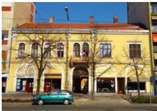
Löfkovits Arthur üzlete egykor és ma