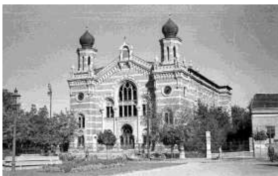
Archív felvétel a Deák Ferenc utcai nagyzsinaagógáról

A 19. század végén virágkorát élő debreceni zsidóság 1892-ben határozta el a nagyváros rangjához méltó nagyzsinaagóga felépítését, ami 1894 és 1897 között Jacob Gärtner bécsi építész tervei szerint épült fel az akkori Nagy Várad, később Deák Ferenc utcán (ma Petőfi tér) vásárolt telken. A stílusában keleties hatású impozáns épület mind belsőleg, mind külsőleg látványos volt. A 40 méter hosszú és 23 méter széles téglalap alakú templomot hagymakupola fedte, magassága 44 méter volt. A nagyzsinaagógát 1897 szeptember elején kétnapos ünnepségen avatták fel, melyen a hitközség vezetősége és tagjai mellett városi és vallási vezetők, országgyűlési képviselők is jelen voltak. Az impozáns zsinagóga sorsát a második világháború pecsételte meg. 1944-ben a világháborús bombázások hatalmas pusztítást okoztak városszerte, melynek sok más épület mellett a nagyzsinaagóga is áldozatul esett. A súlyos károk helyreállítása nagyon költséges volt, a létszámában és anyagi lehetőségeiben is megfogyatkozott zsidó közösség számára szinte lehetetlen feladatnak tűnt. A súlyosan sérült zsinagóga állapota tovább romlott egy tűzvésznek köszönhetően, melyben a templom tetőszerkezete meggyulladt és elpusztult. A város egykori büszkeségét, a Deák Ferenc utcai zsinagógát végül 1962-ben végleg elbontották.