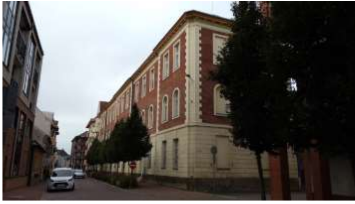
A volt zsidó iskola (ma Ifjúsági Ház)